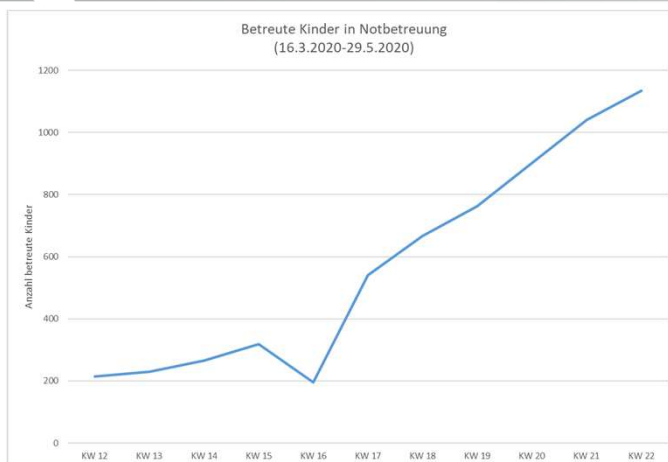
Betreute Kinder in Notbetreuung (16.3.2020-29.5.2020)