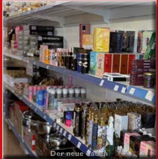
Der neue Laden