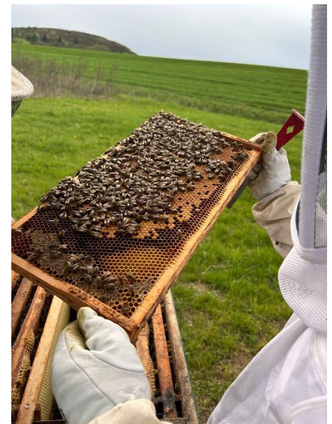
Tim Nowak und Ben Conrad (Abbildung oben)