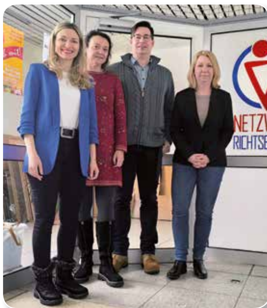
Pressestelle der Universitäts- stadt Marburg

Auch über den Stadtteil hinaus ist „WeGe“ breit vernetzt. Das Projekt arbeitet regelmäßig mit Justiz, Polizei, Jugendämtern, Beratungsstellen und freien Trägern zusammen und ist in regionalen Arbeitskreisen und Netzwerken gegen häusliche Gewalt aktiv. Info-Material steht inzwischen in mehreren Sprachen zur Verfügung.