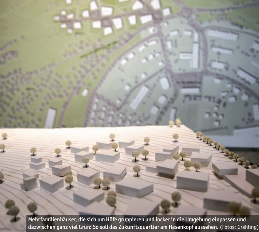
Mehrfamilienhäuser, die sich um Höfe gruppieren und locker in die Umgebung einpassen und dazwischen ganz viel Grün: So soll das Zukunftsquartier am Hasenkopf aussehen.