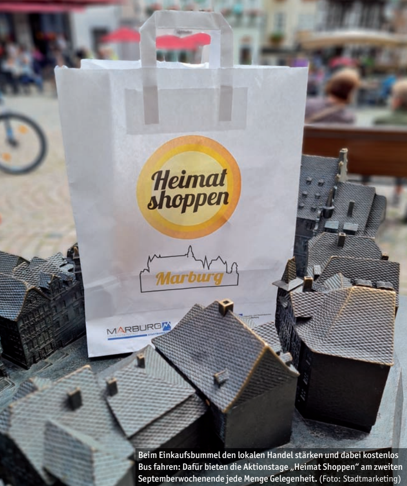
Beim Einkaufsbummel den lokalen Handel stärken und dabei kostenlos Bus fahren: Dafür bieten die Aktionstage „Heimat Shoppen“ am zweiten Septemberwochenende jede Menge Gelegenheit.