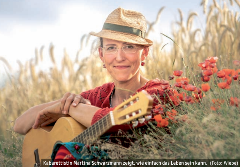
Kabarettistin Martina Schwarzmann zeigt, wie einfach das Leben sein kann.