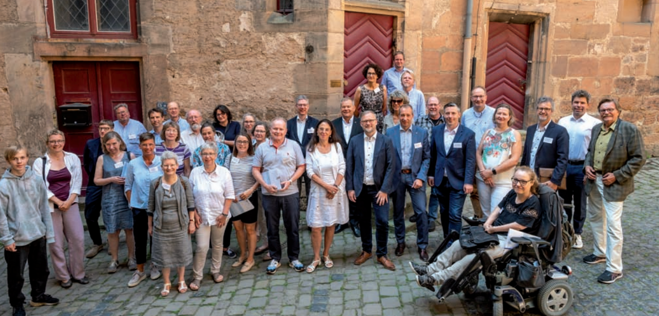
Ein Beirat (Bild) und ein Kuratorium begleiten die Schlossentwicklung der Zukunft. Diese Beteiligung haben Uni und Stadt in Abstimmung mit dem Land auf den Weg gebracht.