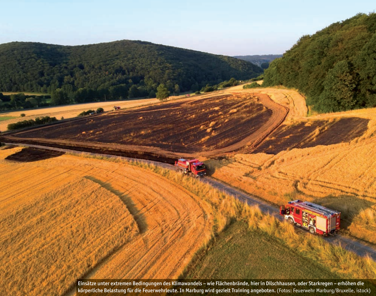
Einsätze unter extremen Bedingungen des Klimawandels – wie Flächenbrände, hier in Dilschhausen, oder Starkregen – erhöhen die körperliche Belastung für die Feuerwehrleute. In Marburg wird gezielt Training angeboten.