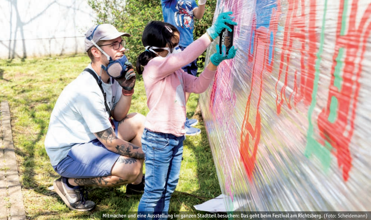
Mitmachen und eine Ausstellung im ganzen Stadtteil besuchen: Das geht beim Festival am Rechtsberg.