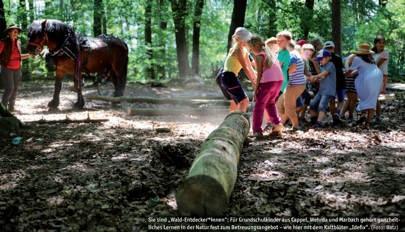
Sie sind „Wald-Entdecker*innen“: Für Grundschul Kinder aus Cappel, Wehrda und Marbach gehört ganzheitliches Lernen in der Natur fest zum Betreuungsangebot – wie hier mit dem Kaltblüter „Idefix“.