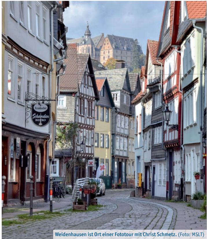
Weidenhausen ist Ort einer Fototour mit Christ Schmetz.

Am 18. September findet die monatliche Sprechstunde für Senior*innen im Beratungszentrum mit integriertem Pflegestützpunkt (BiP) statt. Mitglieder des Marburger Seniorenbeirats informieren von 14.30 Uhr bis 16 Uhr über ihre Arbeit und haben ein offenes Ohr für Interessierte und Ratsuchende. Auch Senior*innen aus den Außenstadtteilen Marburgs sind herzlich eingeladen. Neu ist die Möglichkeit, auch digital miteinander zu sprechen und sich zu sehen. Wer die Sprechstunde vor Ort persönlich nicht erreichen kann, hat die Mög-