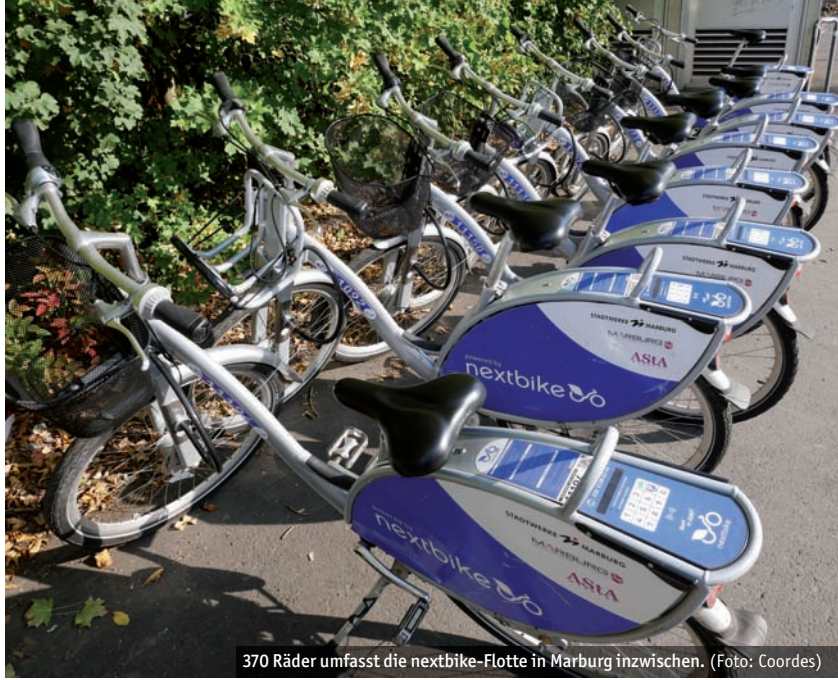
370 Räder umfasst die nextbike-Flotte in Marburg inzwischen.

„Das Leihradssystem wird gut von den Marburger*innen angenommen“, ergänzt Marius Orth von nextbike. „Die Zahl der Ausleihen steigt, ebenso wie die Zahl der Erst-Nutzer*innen.“ Bis