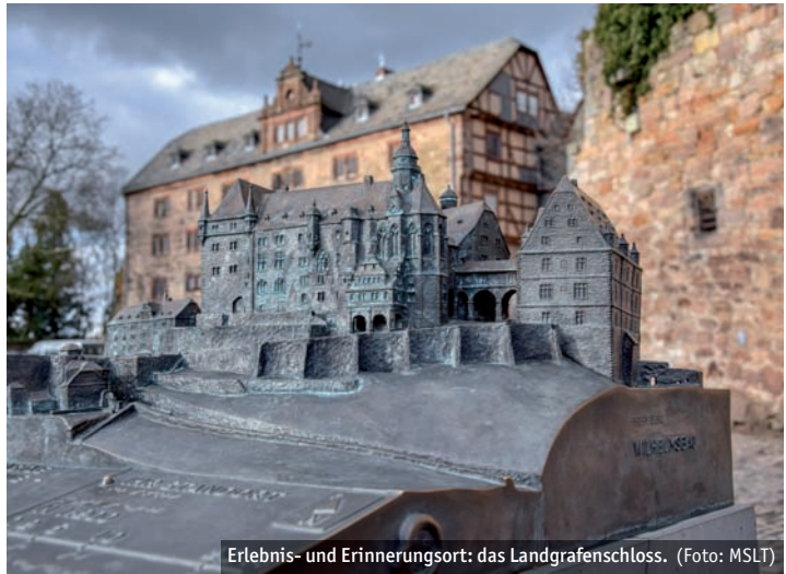
Erlebnis- und Erinnerungsort: das Landgrafenschloss.