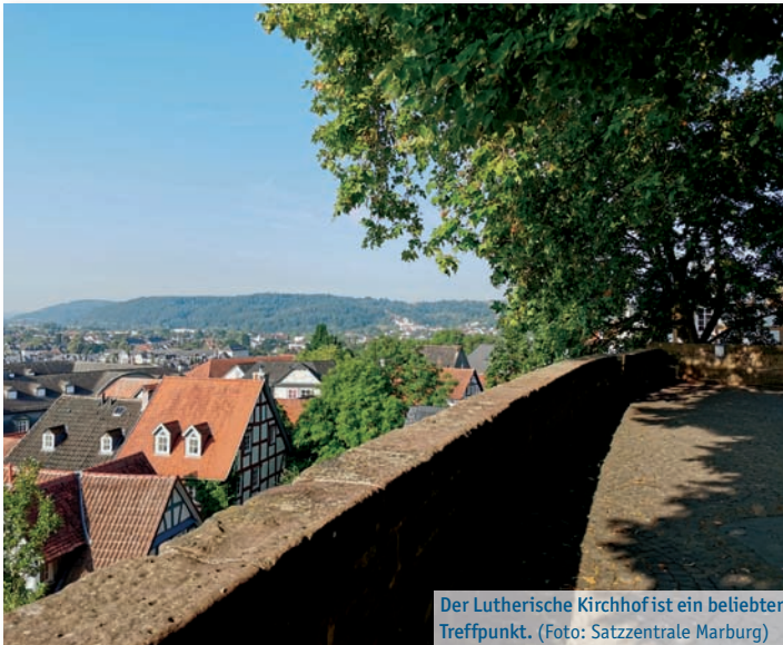
Der Lutherische Kirchhof ist ein beliebter Treffpunkt.

Am Samstag, 16. September, findet von 10 bis 17 Uhr ein Bewegungs- und Gesundheitstag rund um den August-Bebel-Platz in Cappel statt. Das Programm ist unter Mitwirkung verschiedener Akteur*innen aus dem Stadtteil entstanden. Es gibt Kurz-