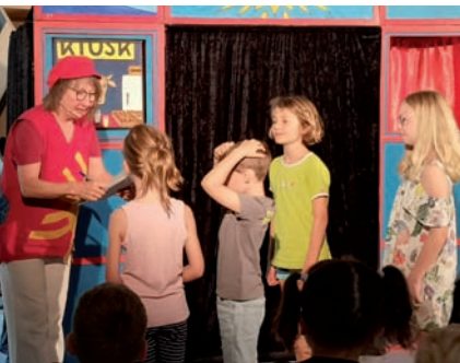
Alle Marburger Grundschulen können die „Prima-Klima-Show“ für sich kostenlos buchen.