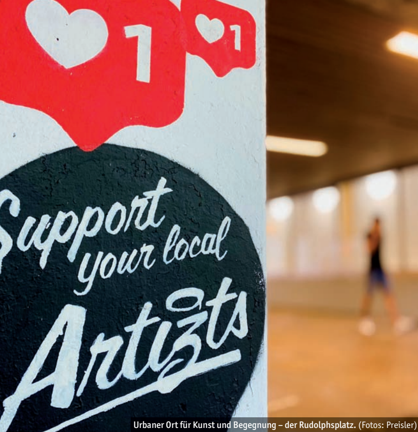
Urbaner Ort für Kunst und Begegnung – der Rudolphsplatz.