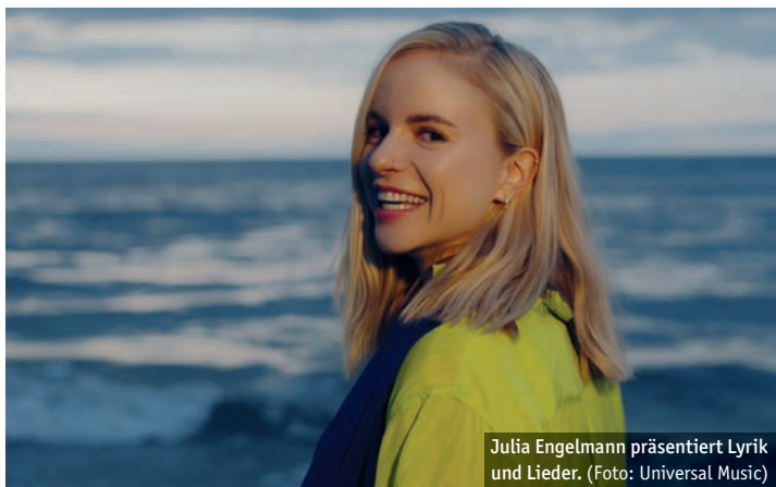
Julia Engelmann präsentiert Lyrik und Lieder.