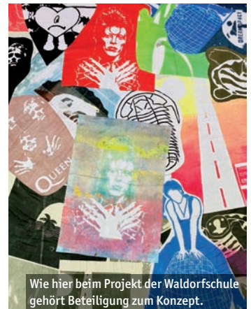
Wie hier beim Projekt der Waldorfschule gehört Beteiligung zum Konzept.

■ Der Eintritt am Rudolphsplatz ist immer frei. Kontakt, Fragen und Infos: nils.boettner@marburg-stadt.de