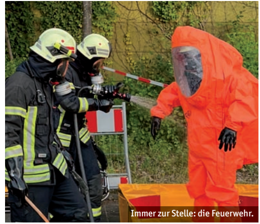
Immer zur Stelle: die Feuerwehr.

ning und Teamsport bis hin zur Bereitstellung eines gut ausgestatteten Sportraumes. Ziel ist es, die Feuerwehrleute zu unterstützen, zusammen zu trainieren und sich mit Teamgeist für die vielfältigen Aufgaben der Einsätze zu wappnen.