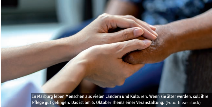
In Marburg leben Menschen aus vielen Ländern und Kulturen. Wenn sie älter werden, soll ihre Pflege gut gelingen. Das ist am 6. Oktober Thema einer Veranstaltung.