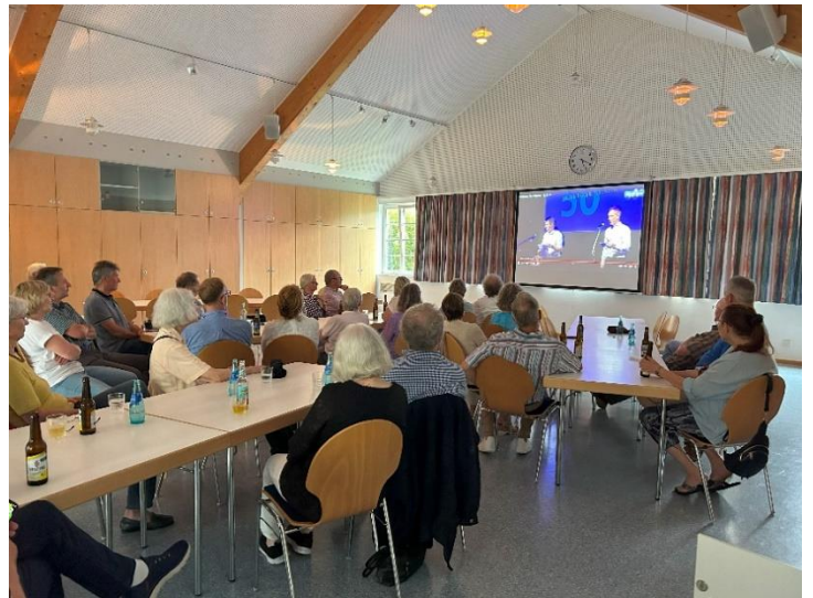
Live Übertragung von der Veranstaltung im KFZ

Das letzte Jahr war geprägt von den Feierlichkeiten zum 50-jährigen Jubiläum der Gebietsreform. Die Stadt und der Ortsbeirat würdigten das Jubiläum mit bunten Veranstaltungen und interessanten Ausstellungen. Der Ortsbeirat hat sich dabei sehr mit den geschichtlichen Hintergründen und der Entwicklung zu dem heutigen Stadtteil beschäftigt. Die Ausarbeitungen stellten wir bei einer zentralen Ausstellung in der Stadthalle, aber auch im Bürgerhaus Wehrshausen aus. Die Besucher begeisterten die geschichtlichen Dokumente und Bilder, in denen sich Wehrshausen durch die Gebietsreform von einer selbstständigen Gemeinde zum Stadtteil verändert hat.