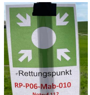
Rettungspunkt 010, K 68 an der Einfahrt zum Kreuz

Die neu aufgestellten Rettungspunkte 034, 035 und ..... sind als temporäre Punkte für die Arbeiten des Rhein-Main Links (Amprion) errichtet worden und zählen nicht zu denen des Forstamtes.