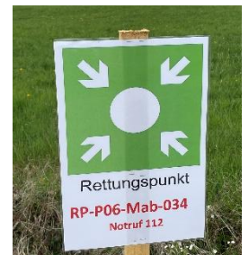
Rettungspunkt 034 am Feuerwehrhaus