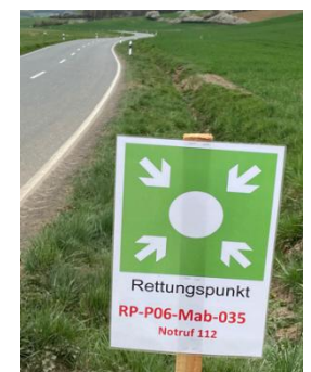
Rettungspunkt 035 an der Allnatalstraße, Einfahrt hinter Buswendeschleife