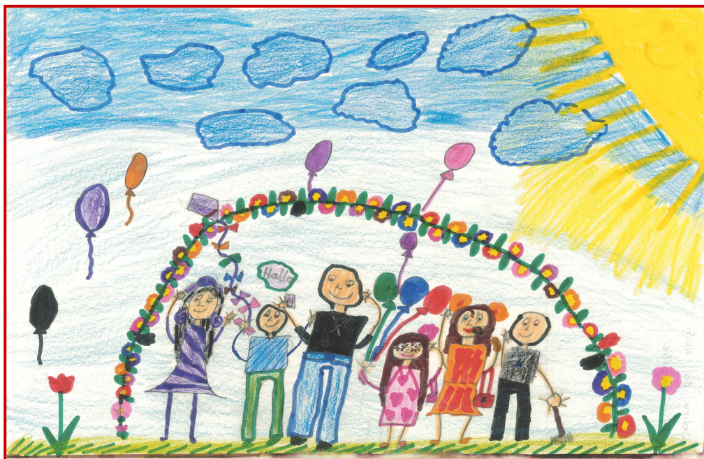
Astrid-Lindgren-Schule; von Sohra; Klasse 3a, 2009