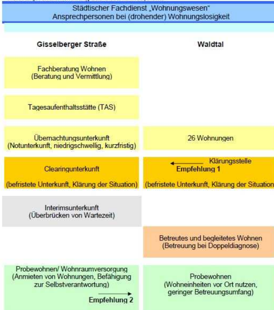
Grafik 2: „Weiterentwicklung des Gesamthilfesystems“ 29

Die Grafik 2 umfasst die aktuellen Angebote, den „Konzeptentwurf 2010“ zur Gisselberger Straße 35 und die Überlegungen für die Obdachlosenwohnungen im Waldtal. Es werden zwei Empfehlungen zur Umsetzung vorgestellt. Diese beiden Vorschläge zur Bündelung im Unterstützungssystem sollen Parallelstrukturen entgegenwirken.