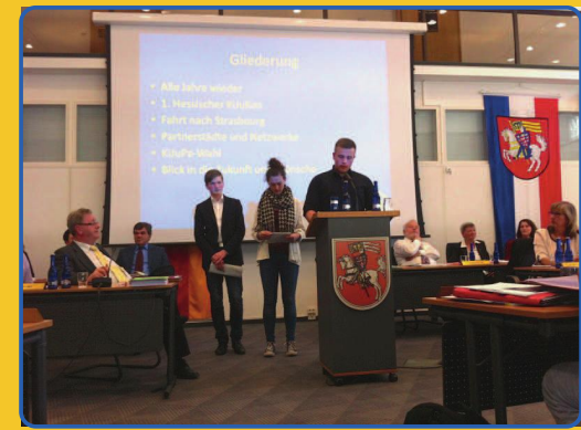
Rederecht in der Stadtverordnetenversammlung

1. Hessischer Kinder- und Jugendkongress in Marburg • Marburger Lesefest • Workshopbereich der Hessischen Kinder- und Jugendtheaterwoche KUSS • „PolitiCut“-Festival • Hessischer Demokratietag • KiJuPa-Workshops