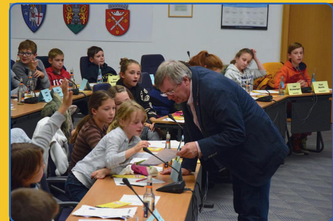
Besprechung von Details eines Antrags mit dem Jugendamtsleiter