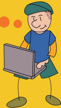
Kennenlernnachmittag des Kinder- und Jugendparlaments