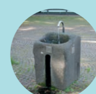
12 BiP, Rudolphsplatz