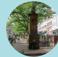
2 Mönchsbrunnen, Steinweg

Auch in einigen städtischen Gebäuden ist es im Rahmen der jeweiligen Öffnungszeiten möglich, mitgebrachte Wasserflaschen aufzufüllen. Die Standorte sind in der Karte mit dem Tropfen markiert.