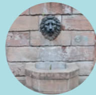
11 Am Plan