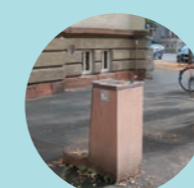
14 Haus der Jugend, Frankfurter Straße