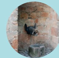
4 Landgraf-Philipp- Straße