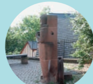
6 Ritterstraße 11