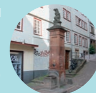
8 Bärenbrunnen, Barfüßerstraße