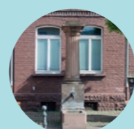
13 Weidenhäuser Straße 100