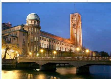
Zentralbau des Deutschen Muse- ums

Das „ Deutsche Museum “ in München ist nach Ausstel- lungsfläche das größte Wissenschafts- und Tech- nikmuseum der Welt.