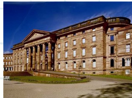
Schloss Wilhelmshöhe in Kassel

https://digital.deutsches- museum.de/virtuell/