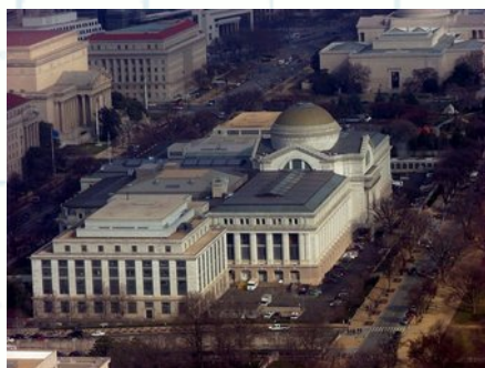
National Museum of Natural History; Amanda (CC BY-2.0)

https://naturalhistory.si.edu/visit/virtual-tour