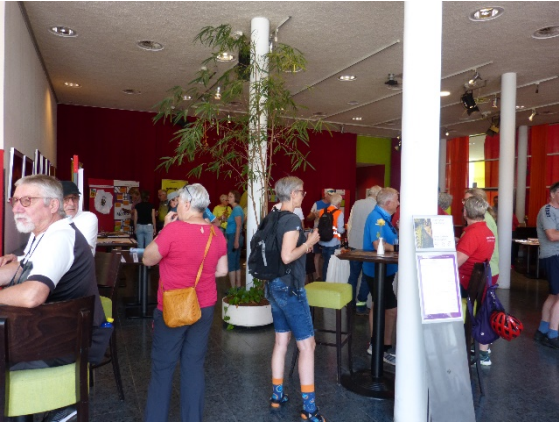
Foyer im TTZ