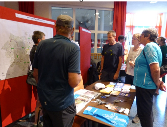
Informationen zur Radwegeplanung (Ldks)