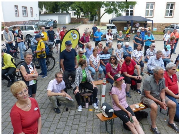
Bei gutem Wetter – Zuschauer im Freien