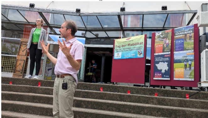
Auftritt des Fast Forward Theatres mit..