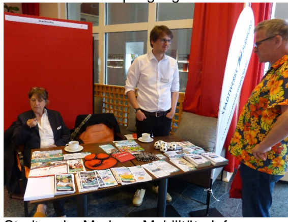
Stadtwerke Marburg Mobilitäts-Infos