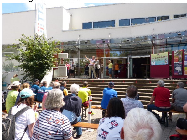
Blicke auf die „Bühne“ vor dem TTZ