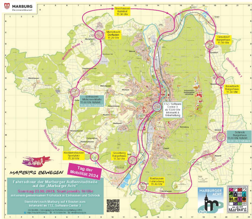
Routen auf der Marburger Acht

Ziel der Veranstaltung war es, auf die Belange der Marburger Außenstadtteile mit Blick auf eine besseren Mobilitätsverbindung zwischen den Stadtteilen, zur Innenstadt und den Arbeits- und Bildungszentren aufmerksam zu machen. Die Veranstaltung war eingebettet in die Feierlichkeiten der 50-jährigen Gebietsreform. 1974 wurden die bisher selbstständigen Außenstadtteile in die Universitätsstadt eingemeindet.