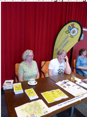
Car- und Bikesharing in Moischt