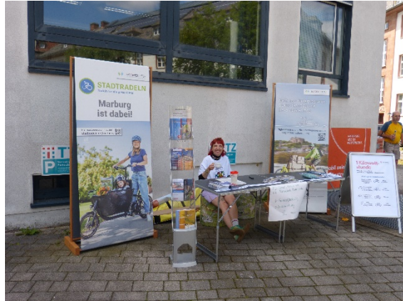
Stadtradeln / FD Klimaschutz