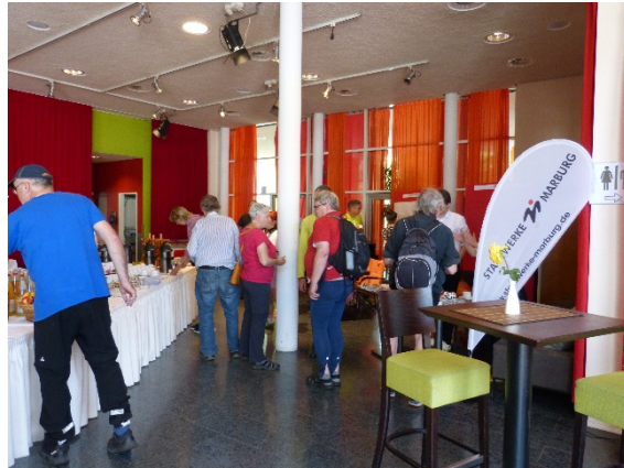
Info-Markt mit Verpflegung