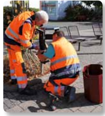
Der DBM hat die neuen Mülleimer mit einer Vorrichtung für Zigarettenkippen angebracht.

Universitätsstadt Marburg Fachdienst Presse- und Öffentlichkeitsarbeit