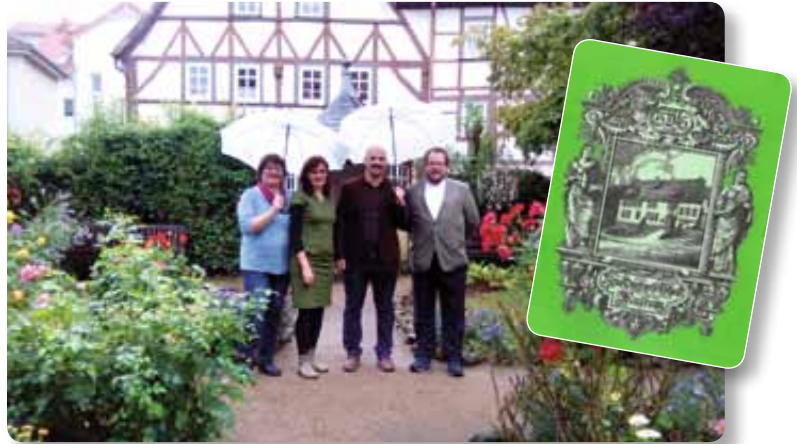
Im schön angelegten Garten des Bachmuseums

Pia Tana Gattinger Netzwerk Richtsberg e.V.