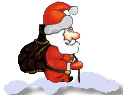
Oliver Henke, Thomaskirche

liche Einladung zum neuen OJR immer donnerstags um 18.30 Uhr ab 13 Jahren.