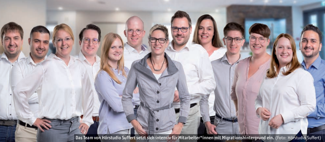
Das Team von Hörstudio Suffert setzt sich intensiv für Mitarbeiter*innen mit Migrationshintergrund ein.