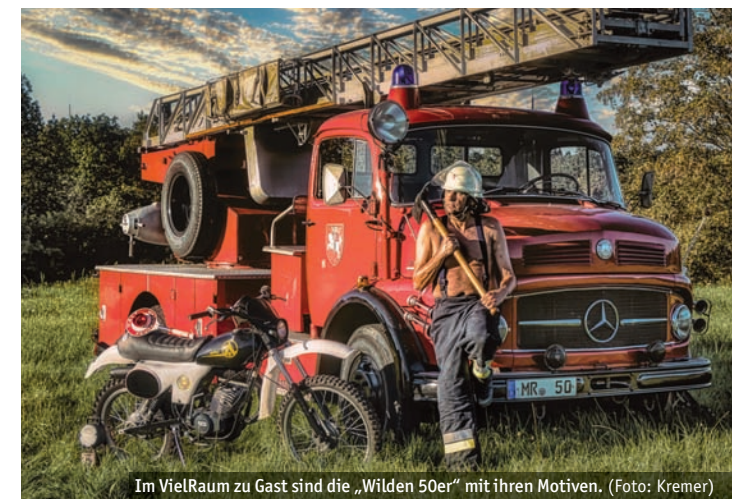
Im VielRaum zu Gast sind die „Wilden 50er“ mit ihren Motiven.