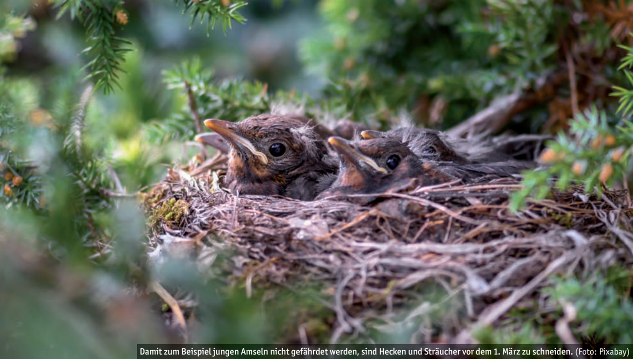
Damit zum Beispiel jungen Amseln nicht gefährdet werden, sind Hecken und Sträucher vor dem 1. März zu schneiden.