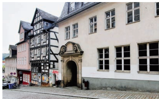
Gesucht war beim letzten Mal das Lahntor, hier mit dem Hörsaalgebäude der Philipps-Universität im Vordergrund.

Ihre Lösung schicken Sie bitte bis 12. Dezember 2024 mit Absender an die Koordinierungsstelle Städtische Publikationen unter publikationen@marburg-stadt.de oder an Pilgrimstein 28a, 35037 Marburg. Rainer Kieselbach