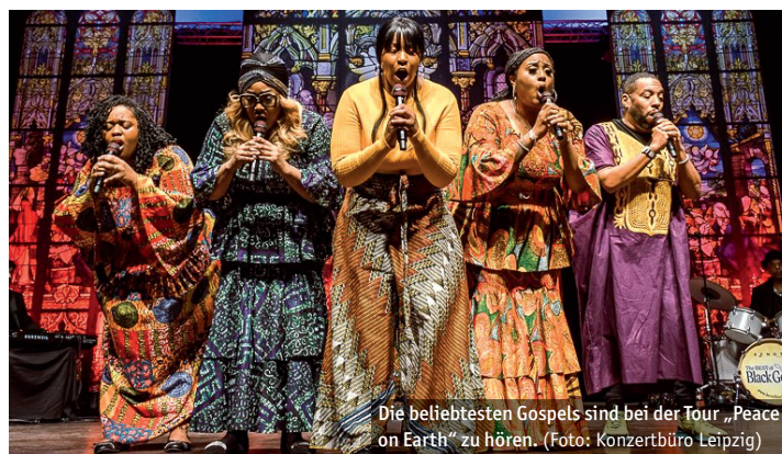
Die beliebtesten Gospels sind bei der Tour „Peace on Earth“ zu hören.