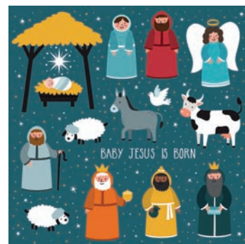
Im Historischen Rathausaal geht es um Krippen – diesmal zeigt die Ausstellung sie auch aus kindlicher Sicht.

■ www.marburg.de/weihnachten ■ www.marburg-liebe.de