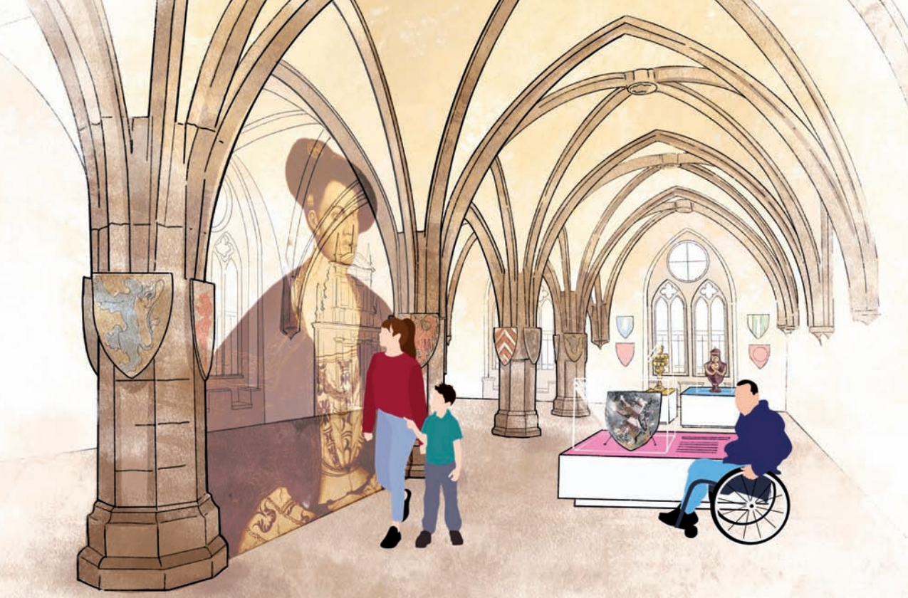
Der Fürstensaal ist einer der größten und schönsten weltlichen Säle der europäischen Gotik. Er soll mehr als bislang Teil des Schlossrundgangs mit wechselnden Ausstellungen werden. (Grafik: Space4 GmbH)