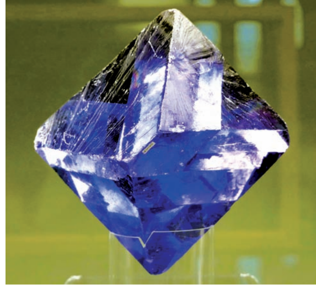
Außergewöhnliche Kunstwerke der Natur gibt es jetzt bei der Ausstellung im Schloss zu entdecken – vom Calcit-Amethyst über einen Fluorit-Kristall bis zum Traubenchalcedon.