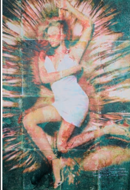
Wie prägt die Macht der Bilder die Wahrnehmung unserer Gesellschaft und den Blick auf die Rolle des Individuums – das thematisiert Gina Bolle (L.), hier mit dem Werk „Beyonce“.