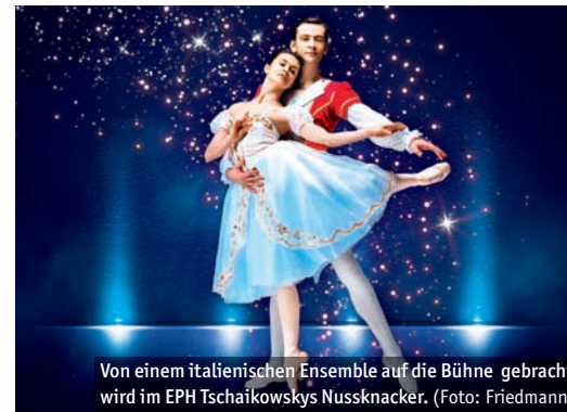
Von einem italienischen Ensemble auf die Bühne gebracht wird im EPH Tschaikowskys Nussknacker.

8.1., 19 Uhr: Für große und kleine Fans kommen die Songs der Animationsfilme „Frozen“ 1 und 2 mit „Die Eiskönigin“ auf die Bühne. Die Gäste erleben mit den Schwestern Elsa und Anna und ihren Gefährten eine Musik-Reise auf Eis. Eistanz und Zirkusakrobatik sowie live gesungene Lieder wollen das Publikum auf eine zauberhafte Reise mitnehmen. Veranstalter: Pluspunkt Events