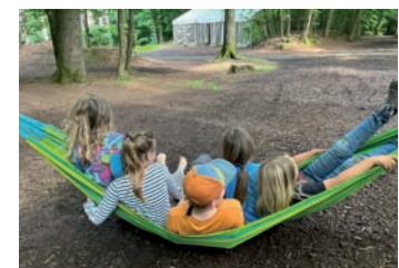
Gemeinsam chillen, gemeinsam Spaß haben mit dem Ferienprogramm der Jugendförderung.

Die Jugendförderung der Stadt Marburg hat für das Jahr 2025 wieder ein buntes Programm aus Ferienbetreuungen, Freizeiten, Kursen und Workshops zusammengestellt. Die Freizeiten führen im Sommer beispielsweise zum Surfen an den Edersee, an die Mecklenburgische Seenplatte, nach