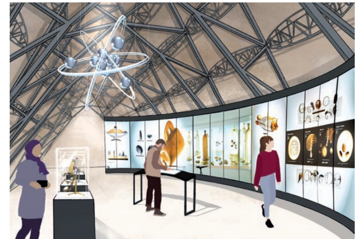
Im bislang selten geöffneten Dachgeschoss sieht das Konzept ein „Schaufenster der Wissenschaft“ vor.