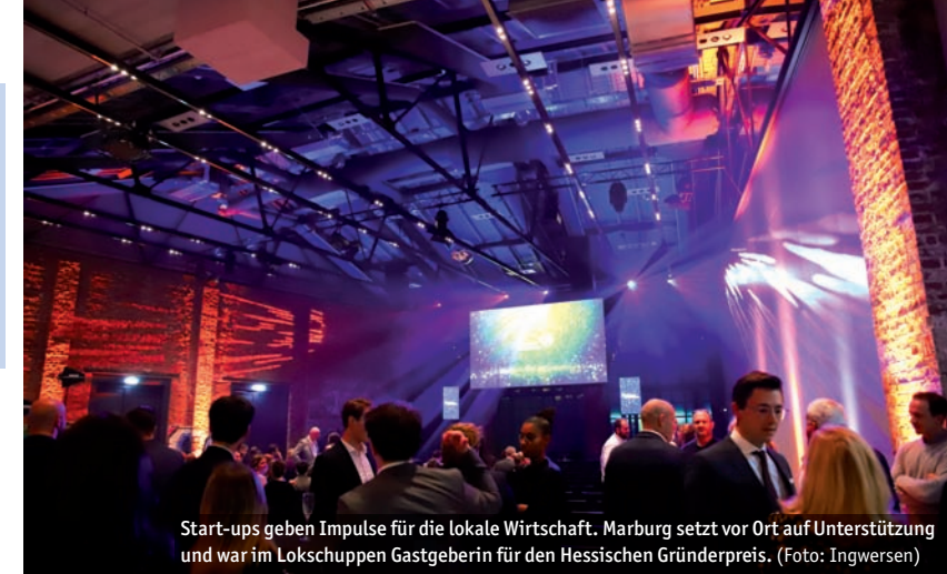
Start-ups geben Impulse für die lokale Wirtschaft. Marburg setzt vor Ort auf Unterstützung und war im Lokschuppen Gastgeberin für den Hessischen Gründerpreis.