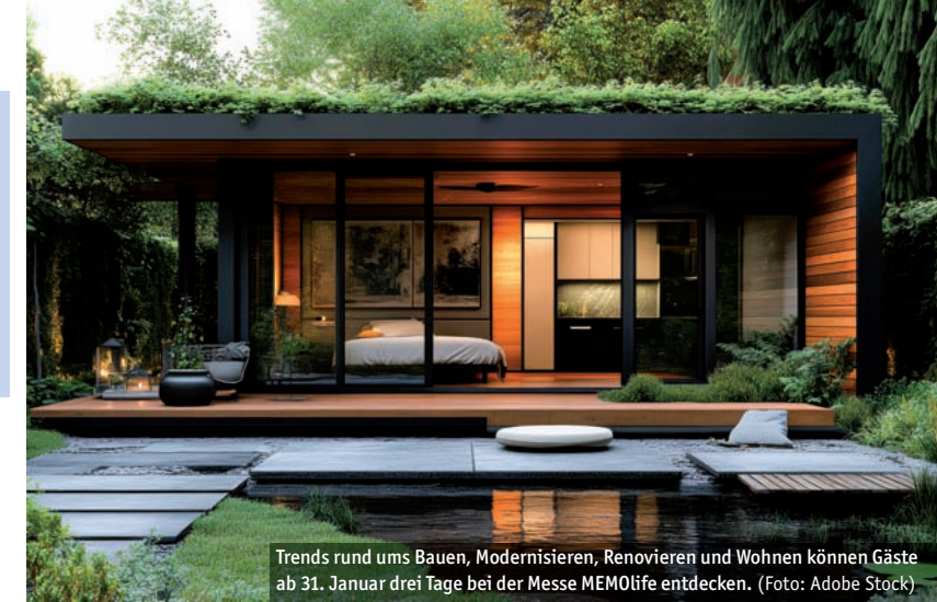
Trends rund ums Bauen, Modernisieren, Renovieren und Wohnen können Gäste ab 31. Januar drei Tage bei der Messe MEMOlife entdecken.