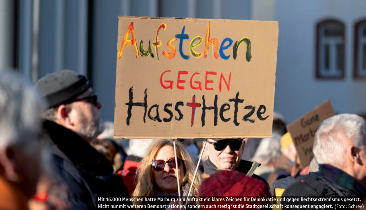
Mit 16.000 Menschen hatte Marburg zum Auftakt ein klares Zeichen für Demokratie und gegen Rechtsextremismus gesetzt. Nicht nur mit weiteren Demonstrationen, sondern auch stetig ist die Stadtgesellschaft konsequent engagiert.