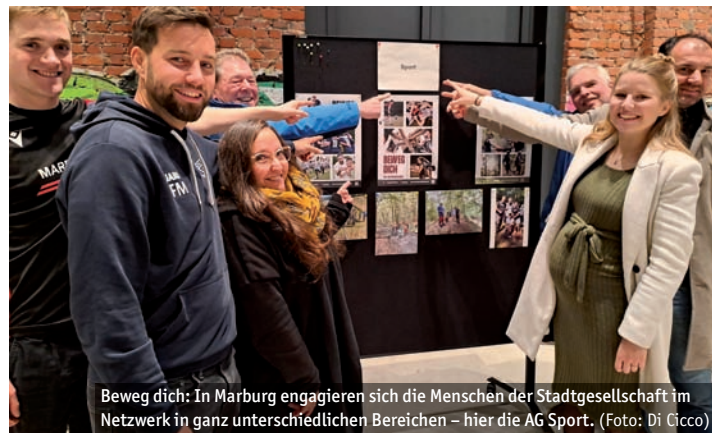
Beweg dich: In Marburg engagieren sich die Menschen der Stadtgesellschaft im Netzwerk in ganz unterschiedlichen Bereichen – hier die AG Sport.

Rechtsextremisten bedroht werden. Keine drei Monate später setzte die Stadt ein weiteres Zeichen: Mehr als 100 Vereine, Initiativen und viele Einzelpersonen kamen auf Einladung der Stadt ins TTZ, um mitzugestalten, was es so in Marburg noch nicht gegeben hatte: die Gründung des „Marburger Netzwerks für Demokratie und gegen Rechtsextremismus“.