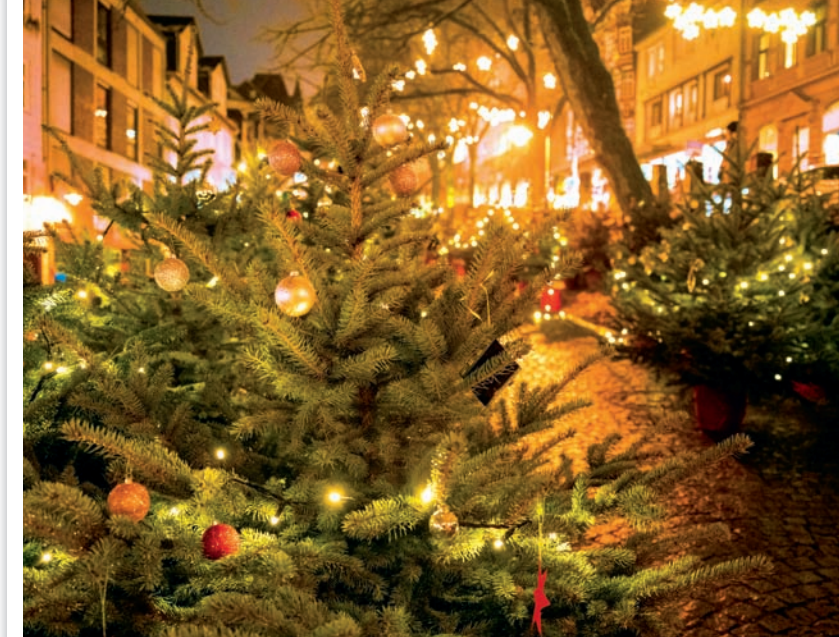
100 Bäume werden zusammen feierlich geschmückt. Im Anschluss lädt der Weihnachtswichtelwald am Steinweg bis 20. Dezember mit einem zauberhaften Programm große und kleine Gäste ein.

7.12. & 8.12., 12-17 Uhr: Das Minihaus am Steinweg verwandelt sich in eine Kunstgalerie. Fotograf Mattis Weber und die Kreativen der Urban Sketchers zeigen ihre Werke – und das Beste: Alles ist auch für wenig Geld erschwinglich.