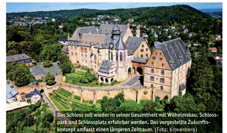
Das Schloss soll wieder in seiner Gesamtheit mit Wilhelmsbau, Schlosspark und Schlossplatz erfahrbar werden. Das vorgestellte Zukunftskonzept umfasst einen längeren Zeitraum.

Die kommenden Jahre sollen aber nicht nur mit Planungen und Diskussionen gefüllt werden. Die Planer*innen empfehlen, bald temporäre Sitzbänke an der Schlossmauer aufzustellen, Stationen zum Mitmachen einzurichten sowie Flohmärkte und Hofkonzerte zu veranstalten.