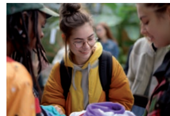
Kinder und Jugendliche bringen Kleidung mit und tauschen sie im Haus der Jugend gegen neue Lieblingsstücke.

Seit 2024 bietet das Jugendbildungswerk der Stadt Kleidertauschpartys für Kinder und Jugendliche im Haus der Jugend an.