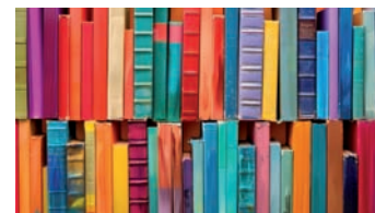
Wie bindet man ein Buch: Das können Kinder in der Stadtbücherei unter Anleitung ausprobieren.

Mit dem weihnachtlichen Buchbinden am 18. Dezember ab 15.30 Uhr und dem Bobbycar-Kino am 15. Januar bietet die Stadtbücherei Marburg