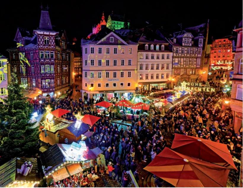
Mit Weihnachts- und Adventsmarkt, Krippenausstellung und Krippenpfad, Weihnachtssingen und fast 100 Veranstaltungen lädt die Weihnachtsstadt Marburger*innen und ihre Gäste ein.