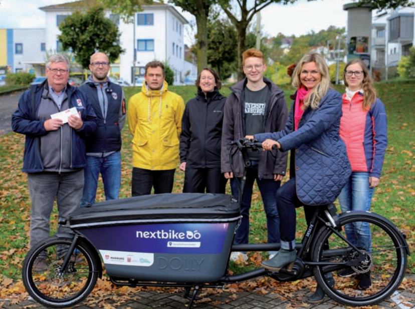
An zwölf Standorten können sich Marburger*innen jetzt E-Lastenräder ausleihen. Sie ergänzen mit für die Topographie der Stadt ausgestatteten Motoren das Mobilitätsangebot. Bürgermeisterin Nadine Bernshausen (2. v. r.) wirbt mit städtischen Fachdiensten und AStA der Uni dafür, das Angebot einfach und unkompliziert auszuprobieren.