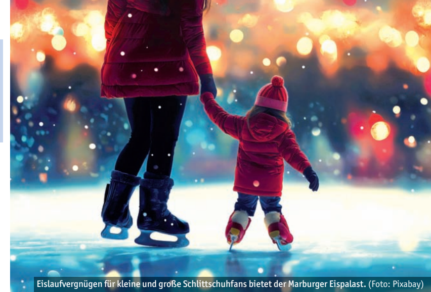
Eislaufvergnügen für kleine und große Schlittschuhfans bietet der Marburger Eispalast.

Am 23. Dezember (Montag) und am 7. Januar (Dienstag) von 8.30 bis 10 Uhr gibt es zusätzlich eine Einführung ins Eishockey für Kinder ab acht Jahren. Hierzu ist eine Anmeldung über eispalast@marburg-stadt.de nötig. Auch für die „Kleine Eisschule“ für Anfänger*innen ab sechs Jahren am Freitag, 3. Januar, und am Mittwoch, 8. Januar, jeweils von 8.30 bis 10 Uhr wird vorab um Anmeldung gebeten. Ein inklusives Kombi-Eislauf-Programm richtet sich an Menschen mit Einschränkungen, Rollstuhlfahrer*innen und ältere Menschen, wenn sie dies möchten. Jeden Montag – außer 23. Dezember und 30. Dezember –