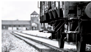
80 Jahre nach der Befreiung widmet sich der Politische Salon der Frage des Gedenkens an das KZ Auschwitz.