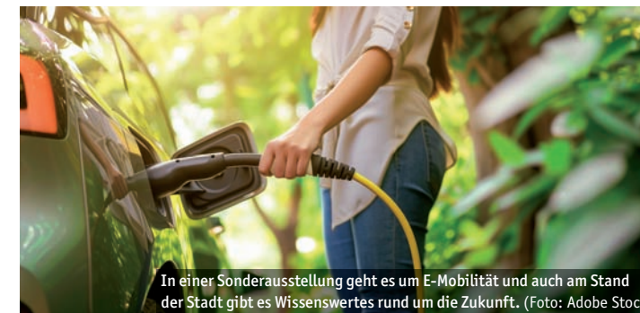
In einer Sonderausstellung geht es um E-Mobilität und auch am Stand der Stadt gibt es Wissenswertes rund um die Zukunft.

Wissenswertes und Unterhaltsames gibt es dabei u. a. zum Sport, zu Fairerem Handel, Angeboten für Kinder