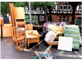
So wie auf diesem Foto sollten die Sperrmüllanteile zukünftig getrennt bereitgestellt werden.

zeug abholen. Bürger*innen stellen deshalb z. B. Regale, Kommoden, Kleiderschränke, Tische und Stühle ab dem neuen Jahr beim Sperrmülltermin bitte getrennt vom sogenannten Restsperrmüll (Polstermöbel, Matratzen, etc.) an der Straße bereit. Das unterstützt die Müllwerker*innen auf ihrer Sperrmülltour zügig voranzukommen und täglich möglichst viele Haushalte anzufahren. Marburger*innen sind seit langem gewohnt, Metall- und Elektrogegenstände bei der Sperrmüllabholung getrennt zu sortieren. Auf diese Weise gehen wertvolle Rohstoffe nicht im großen Gemisch des sonstigen Hausrats verloren. Mit der Sortierung des Holzanteils bereits ab 2025 wird