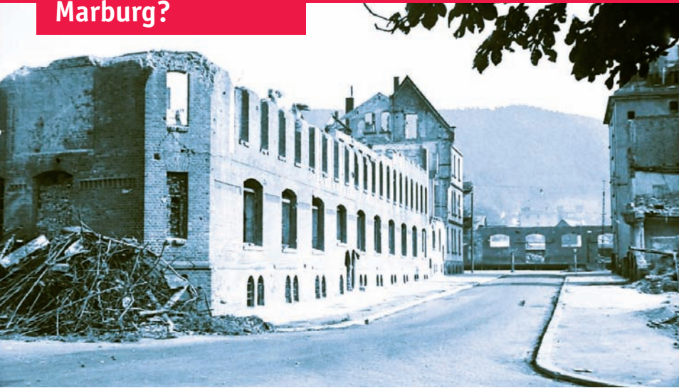
Gesucht wird dieses Mal ein Fabrikgebäude, das im Zweiten Weltkrieg von Bomben getroffen wurde und 1949 wieder den Betrieb aufnahm.

Im Blickpunkt des letzten Suchfotos von 1910 stand das Gebäude Lahntor 1, das ehemalige „Vereinigte Waisenhaus“ – auch im Gebäude Mainzer Gasse 31 war wie berichtet einst einmal das Waisenhaus Marburgs untergebracht.