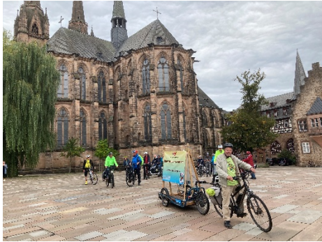
Fahrrad-Corso am Firmaneiplatz

Umsetzung für die Beschilderung der „Marburger Acht“ und des Mammut-Wanderweges durch die Außenstadtteile wurde von Anja Lenz, Marburg-Stadt-Land-Tourismus, angekündigt.