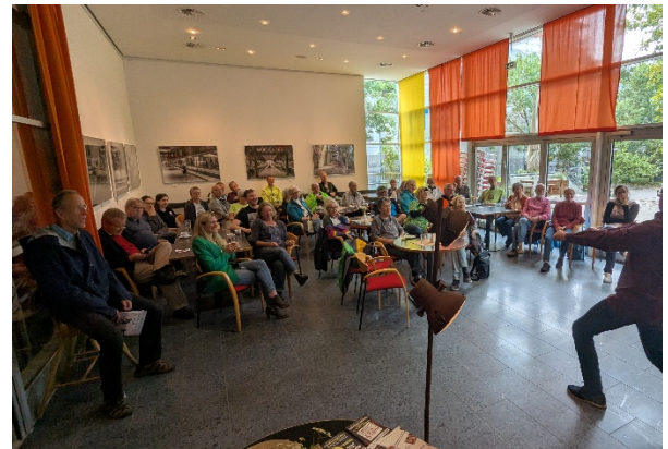
Teilnehmende erfreuen sich der „Fast Forward Theatre“ Inspirationen

Der Fachdienst Klimaschutz der Stadt Marburg hat die Nutzung von Solaranlagen, insbesondere Balkonsolarmodule, beworben hatte weitere Informationen mit anderen Maßnahmen präsentiert.