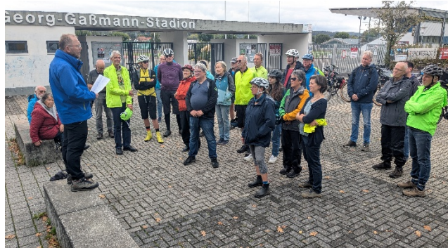
Rede von K-Denfeld zur Leopold-Lucas-Str.