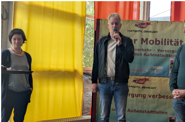
Vertreter von Stadt und Landkreise stellen die Ergebnisse vor.