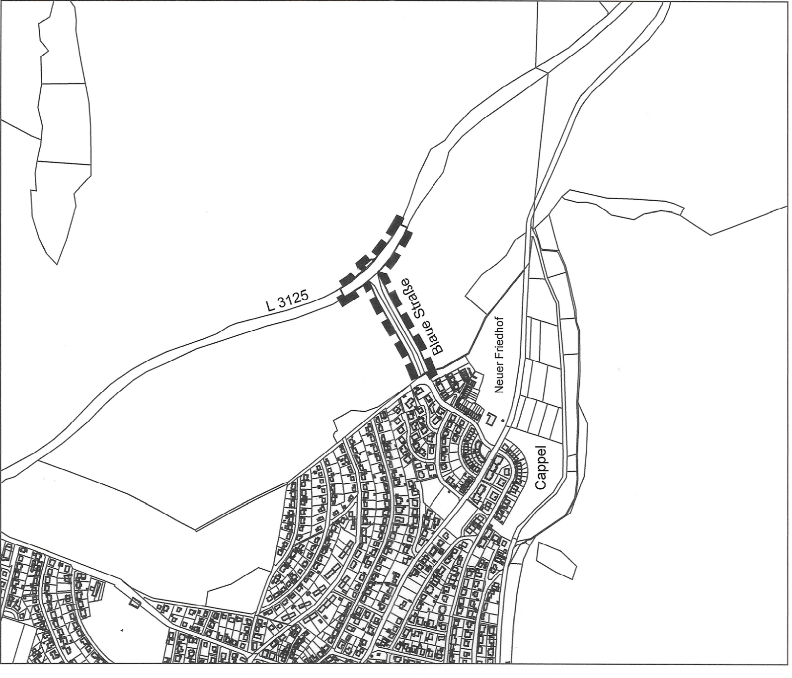
Übersichtskarte: Stadt Marburg Maßstab 1 : 5.000

Wasserschutzgebiet Der Geltungsbereich des Bebauungsplans liegt innerhalb der Zone III des festgesetzten Wasserschutzgebiets für die Wassergewinnungszwecke Fachmosen Rorhausen und Tierschutzgebiet am der Stadt Marburg. Die entsprechende Verordnung vom 25.10.1987 (SAPz. 48/1987 S. 1493) ist zu beachten. Die für die jeweiligen Schutzzonen geltenden Verbote und Gebote sind zwingend einzuhalten.